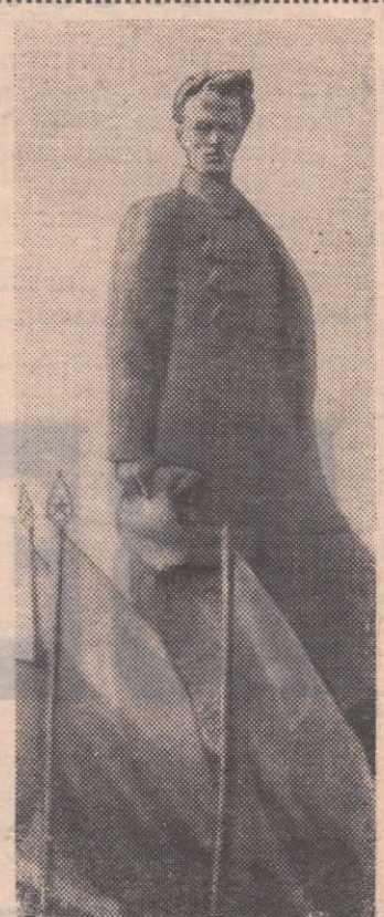
ХМЕЛЬНИЦКАЯ ОБЛАСТЬ. На днях в Шепетовке открыт памятник Н. Островскому.